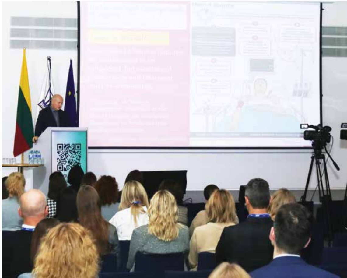
Šiomet kongrese „Baltic Days Of Dentistry 2025“ dėmesys skirtas burnos ligoms ir bendrai sveikatai, jų ryšiui bei priežiūros ypatumams.

Anot jos, nors universitete gydytojai odontologai bendrosios sveikatos kurso yra mokomi, sparčiai tobulėjanti medicina verčia žinias nuolat aktualizuoti.