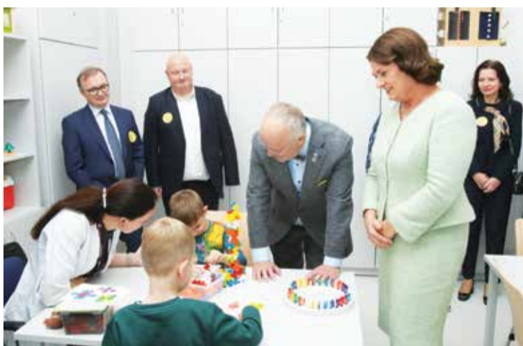
Santaros klinikos VAIKAMS – tai paslaugų visuma, apimanti visą vaikų amžiaus spektrą – nuo kūdikių iki paauglių, nuo skubios pagalbos iki reabilitacijos, nuo pirmųjų ligos požymių iki visiško pasveikimo.