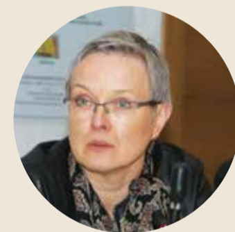
Lietuvos medikų sąjūdžio pirmininkė