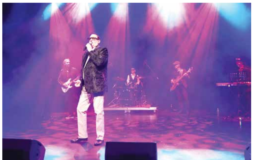
Šventę užbaigė grupės „Hiperbolė“ koncertas. Svečiai džiaugėsi, kad būtent šios grupės melodijos lydėjo ne vieną ligoninės istorijos dešimtmetį ir vis dar jungia skirtingų kartų medikus.