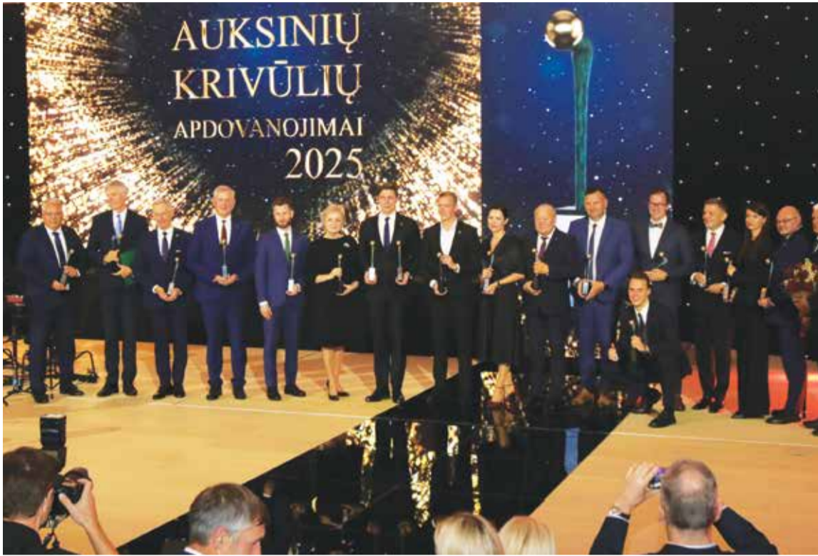
Vilniuje įvairiose srityse labiausiai pasižymėjusioms savivaldybėms įteiktos bronzinės „Auksinių krivūlių“ statulėlės – svarbiausieji savivaldų metų apdovanojimai.