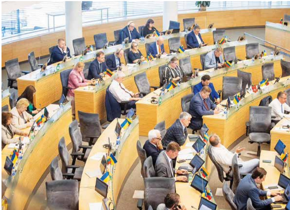
Seime įstatymo pataisų projektai, kuriuose norima naikinti priemokas už gydymo paslaugas, apmokamas PSDF lėšomis, bus svarstomi dar šioje rudens sesijoje.

Po savaitės pertraukos į Seimo Sveikatos reikalų komitetą grįžo priemonių naikinimo klausimas. Ir nors tai jau ketvirtasis posėdis, kuris komitete organizuojamas šiuo klausimu, aistros vis dar nerimsta. „Aš matau, kad važiuojate linksmiais kalneliais į Konstitucinį Teismą“, – posėdyje kalbėjo valdančiajai koalicijai priklausančios partijos „Nemuno aušra“ pirmininkas Remigijus Žemaitaitis.