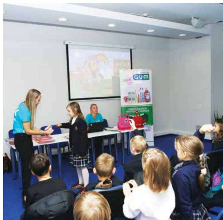
Jau trečią kartą Odontologų rūmai inicijuoja Vilniaus miesto mažiesiems moksleiviams nemokamas interaktyvias pamokas apie burnos sveikatos išsaugojimo principus. Šiose pamokose dalyvavo per 170 pradinių klasių moksleivių iš keturių skirtingų Vilniaus mokyklų.

„Nuostabu, kad Odontologų rūmai skiria dėmesį tokioms iniciatyvoms. Tai puiki paskata vaikams rūpintis savo dantimis.