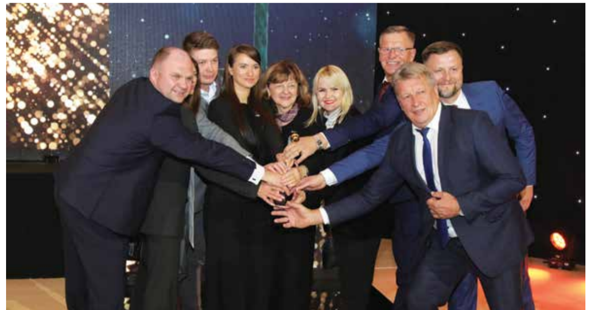
„Už iniciatyvas kurti saugesnę visuomenę ir svarų indėlį į resocializaciją“ krivūle Alytaus miesto savivaldybei skyrė Teisingumo ministerija.